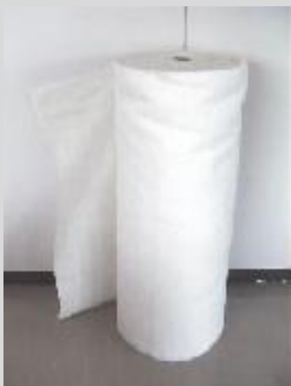
S G式ろ過砂汚染目詰まり防止シート

シートの汚れは高圧洗浄で簡単に落とすことができます。洗浄後は再びろ過池に敷込み、繰り返し使用できます。